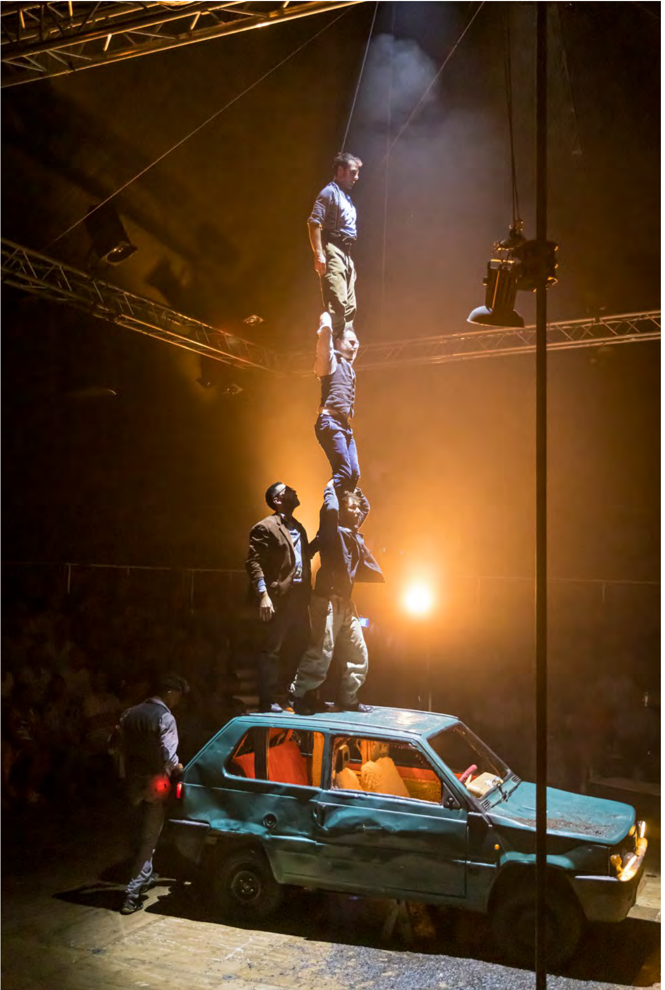
2024 - Samen morgen maken