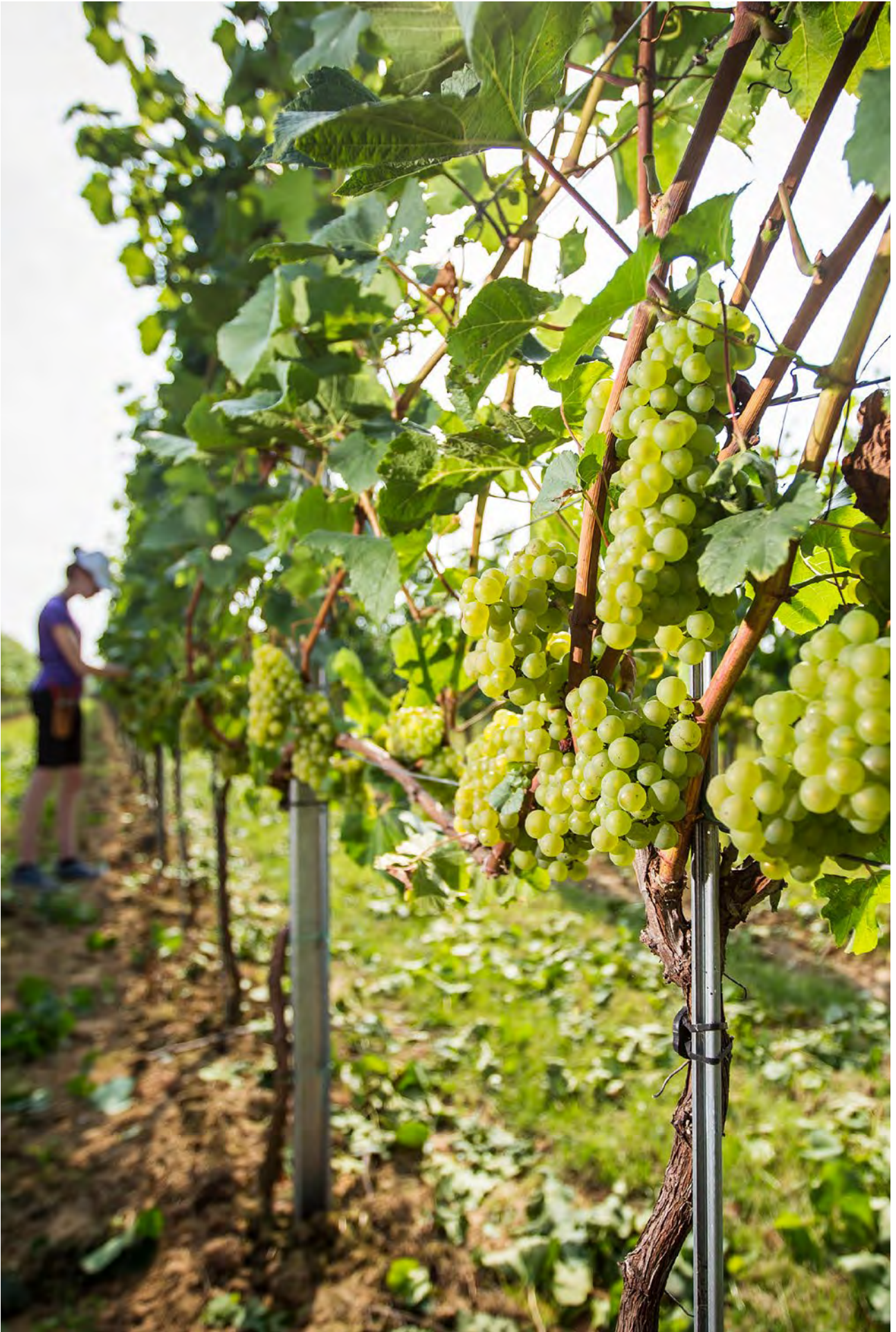
2024 - Samen morgen maken