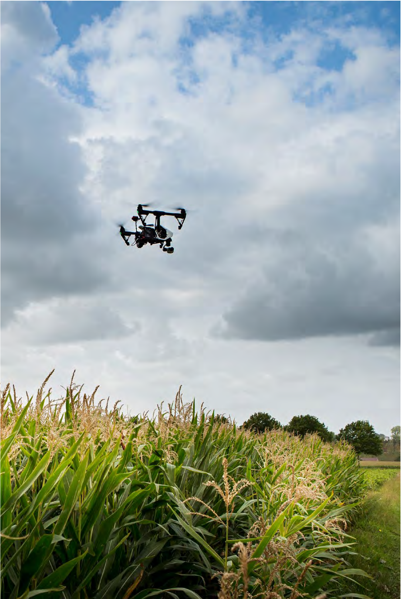
2024 - Samen morgen maken